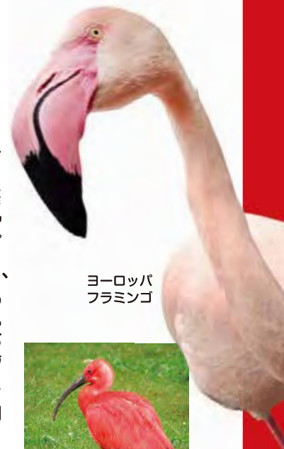
ヨーロッパ フラミンゴ

いろ け ピンク色の「毛」のウサギは残念ながらいません。しかし、アナウサギの赤ちゃんは毛がない状態で生まれてくるので、ピンク色の肌をしています。ハダカデバネズミという動物も毛がないので肌がピンク色に見えます。シロイルカなども薄いピンク色に見えます。これらの動物は肌の色が薄く、体の中を流れる「血」の赤色が透けて見えるためです。ですから、「ピンク色のウサギ」は期間限定でいる、ということになるかもしれませんね。鳥や魚、虫などもピンク色のものがあるそうです。ピンク色である理由は様々ですが、長い長い時間をかけて進化してきた形なんですね。宮崎市フェニックス自然動物園ではきれいなピンク色のフラミンゴやショウジョウトキを見ることが出来ますよ。