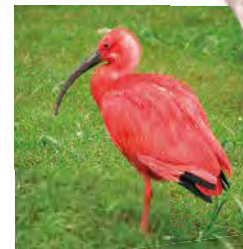
ショウジョウトキ