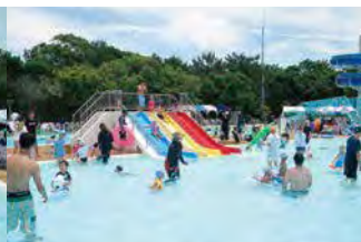
こどもプール(滑り台付き)・幼児プール