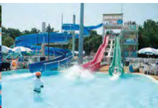
3種のウォータースライダー