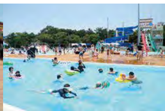
流れにまかせて夏を満喫!