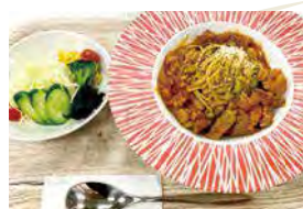
ハッシュドポークと枝豆のラグー