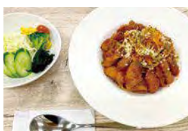
サルシッチャとベーコンのアマトリチャーナロッサ