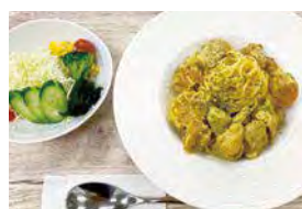
チキンとジャガイモのスパイシークリームカレー