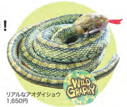
リアルなアオダイショウ 1,650円

園内2か所の売店「ひなたショップ」「みどりの森ショップ」ではヘビのぬいぐるみを販売しています。アオダイショウ、コブラ、ニシキヘビなどのリアルなものや、ちょっとポップなものなど勢ぞろいしています。一年の守り神(?)としていかがでしょうか。2025年「巳」(ヘビ)年、良い一年になりますように!