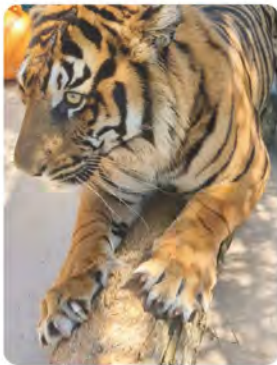
普段は隠れていますが爪とぎのときは鋭く大きな爪が出てきます。▶