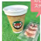
※テイクアウトの場合は紙カップでのご提供となります。クッキーは袋に入っているためです。