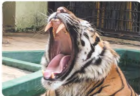
▲大きなあくびと立派な牙は迫力満点!