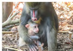
8月18日、あちこち行きたい赤ちゃんと、すぐ抱っこするエルサ。

赤ちゃんと他のマンドリルとの相性が気になりましたが、ディディ・マンマルとの同居もスムーズで特にケンカもせず、今では4頭一緒に展示場で過ごしています。