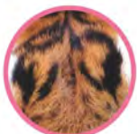
ファントムの名前の由来となった額の「幻」の文字のような模様。