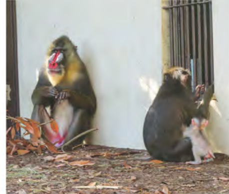
父親のマンマルといっしょ。8月22日撮影。

赤ちゃんは毎日元気マンタンで、毎日行動範囲も広がって母親から少し離れた場所を探検する様子が観察できるようになってきました。