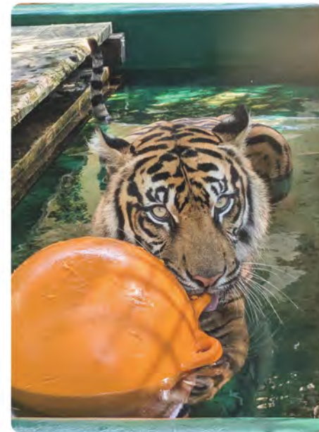
暑い日中にはあまりプールに入らず、朝一や雨の日によくプールではしゃいでいます。