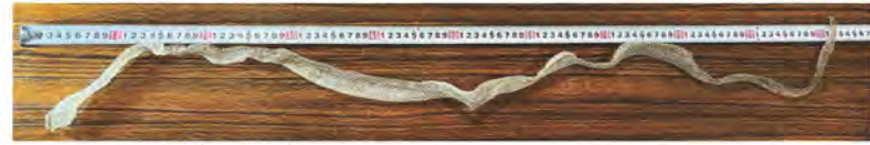
アオダイショウの抜け殻。のばすと約120cmもありました。

Q2 この前産まれたマンドリルの赤ちゃんは、何年くらいでお父さんの様な綺麗な色の顔になりますか？