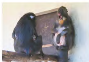
7月31日、メスのディディは赤ちゃんが気になりますがエルサがまだ警戒しているようです。