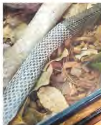
アオダイショウの脱皮中のアオダイショウ。左側の白い部分が剥がれている皮です。