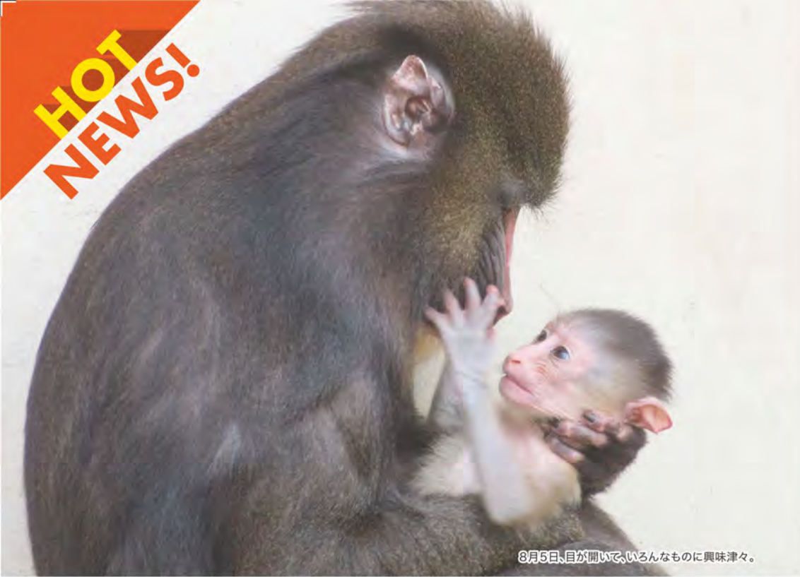
8月5日、目が開いて、いろんなものに興味津々。