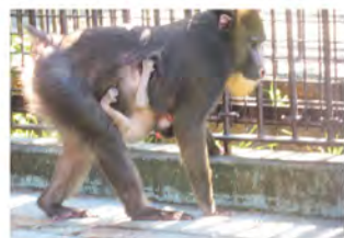
7月31日、一般公開をしました。お母さんにしっかりしがみ付いています。