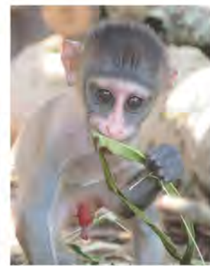
ヒナタ(オス)。 カラフルになるのはいつからかな？ 成長の様子はSNS等で紹介していきますね。

動物に関する質問大募集！ 動物園のホームページにある応募専用ページかハガキにて動物園までお送りください。採用された方には「動物園オリジナルポストカード5枚セット」をプレゼント！ ※すべての質問が採用されるものではありませんのでご了承ください。