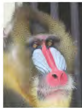
マンドリルのオス(マンマル)。

ちなみに、マンドリルの顔の青は本当に青い色をしているのではありません。マンドリルだけではなく哺乳類は青い色素を持っていません。青く見えるのは表面でこぼこに光が反射したりして青く見えているだけなのです。このような色を「構造色」といいます。鳥や虫の色がカラフルなのも多くはこの「構造色」を利用しているからです。