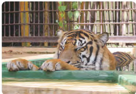
暑い日中はプールに浸かって涼んでいます。慎重派のファントムは後ろ足からそろりと入ります。