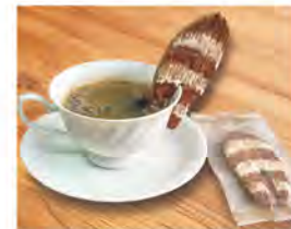
レッサーパンダのしっぽカフェ 500円 ※カフェラテの場合は550円

新メニュー「レッサーパンダのしっぽカフェ」ができました。なんとクッキーは「セラトン・グランデ・オーシャンリゾート」のパティシエ手づくり! さらに、クッキーはカップに立てることができますので、かわいい写真も撮れちゃいますよ! ほっと一息コーヒータイムを楽しんでみてはいかがでしょうか。