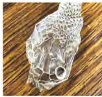
抜け殻には、ちゃんと目のあとも残っていますよ。

A エビやカニは硬い体をしていて、成長するためにじゃまになる硬い殻を脱ぎ捨てます。ヘビは硬い皮膚はしていないので、成長のためではなく、古くなった皮膚の組織をはぎ落とすために脱皮をします（私たちの体からも出ている「アカ」を落としているようなものです）。ヘビは全身で一度にそれが起こるのでとても分かりやすいです。 トカゲなどの他の爬虫類やカエルのような両生類も脱皮をしますが、部分ごとや小さい破片で剥げ落ちていくので分かりにくいのです（ヘビは手足がないので一度に脱ぎやすいですね）。 どのくらいの間隔で脱皮をするかは決まっていりませんが、若い時には短い期間で脱皮するとされています。ニシキヘビのような大きなヘビのおとなでは、年に1回ということもあるようです。