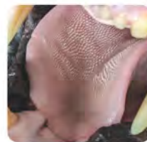
舌にはトゲトゲがびっしり生えていて、骨についた細かな肉もそぎ落とします。

密猟や生息域の減少により、野生下では400頭ほどにまで数を減らし、絶滅の危機にあります。日本の動物園でも協力し合って繁殖に取り組んでいます。