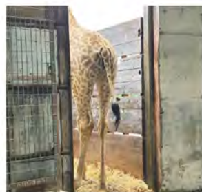
トレーニング4日目。入ってくれました!