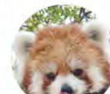
レッサーパンダ「リコ」