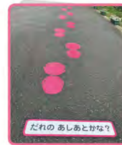
だれの あしあとかな?