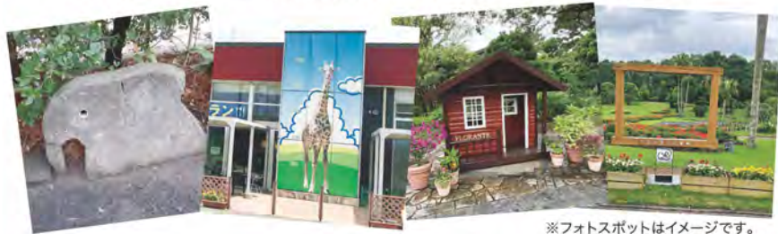
※フォトスポットはイメージです。