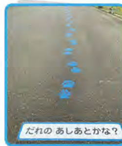
だれの あしあとかな?

動物園のゲートから園内に向かう坂道において、来園者のみなさまに少しでも楽しんで歩いていただくため『どうぶつあしあとクイズ』が登場しました! これは、宮崎県立宮崎西高等学校附属中学校の生徒に取り組んでいただいた動物園の「課題解決学習プログラム」の中でご提案のあった内容を基に取り組んだものです。動物に出会うまでの道のりをワクワクしながら楽しんで歩いてみてはいかがでしょうか。