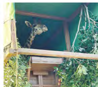
7月3日夜、北九州に向けて出発です。