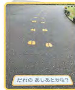
だれの あしあとかな?